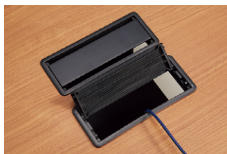
開閉式配線カバー 簡易に開閉できる配線カバーからスムーズにケーブル類を机上面に取り出せます。