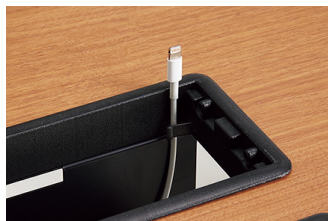
コードフック 開口部にフックを採用。コードのずり落ちを防ぎます。