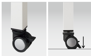
キャスター脚(リフトアップキャスター) キャスター脚タイプを選択することでアクティブに動かして使用することができます。