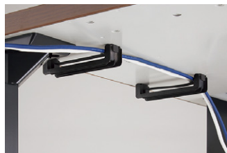
横渡配線フック(樹脂製) 天板の裏側に横渡配線フックを標準装備しています。ワンタッチで開閉ができ、配線作業が容易に行えます。