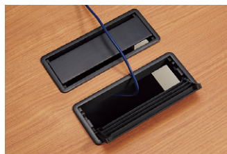
両側開閉可能 配線カバーは両側から開閉でき便利です。