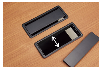
最大開口 配線カバーを取り外すことでより広いスペースで作業が行えます。