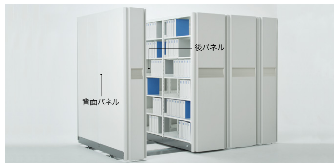
※背面パネルと後パネルはオプションです。

よく触れるからこそ!細菌の増殖を抑えるクリーンな抗菌樹脂ハンドルを採用! 搭載されている書架も抗菌粉体塗装が施された安全・安心・清潔な移動ラックです。 ※書架は抗ウイルス粉体塗装を承ります。詳しくは担当者にお問い合わせください。