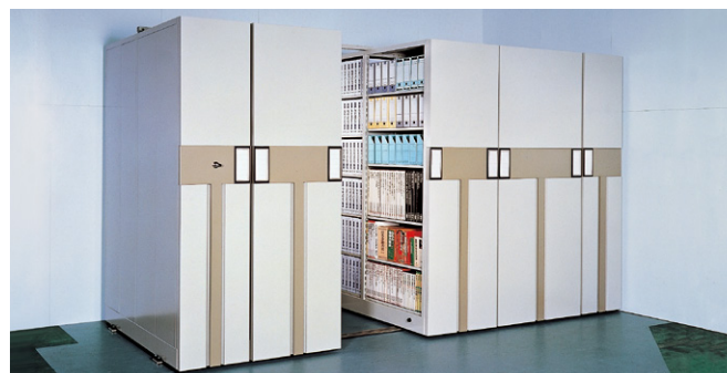
※セット写真は本体高さ2300mm仕様で参考イメージです。