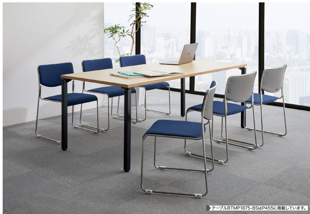
テーブルBTMP1875-BSはP455に掲載しています。