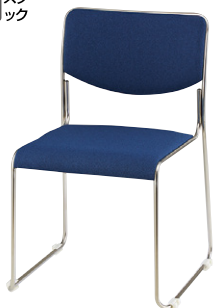
E169F-IBL ¥25,500 ◆ 張地：布張り 質量：4.3kg