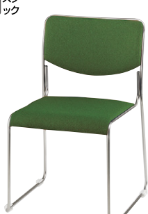
E169F-FGR ¥25,500 ◆ 張地：布張り 質量：4.3kg