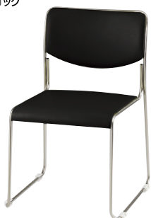
E169-BK ¥23,300 ◆ 張地：ビニールレザー張り 質量：4.3kg