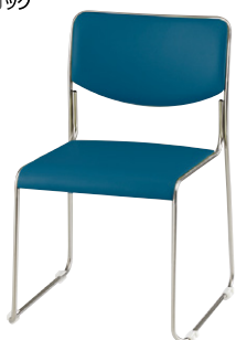
E169-CBL ¥23,300 ◆ 張地：ビニールレザー張り 質量：4.3kg