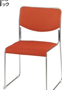
E169F-CR ¥25,500 ◆ 張地：布張り 質量：4.3kg