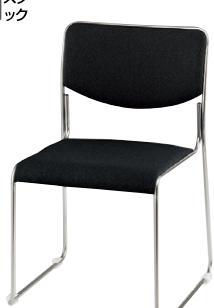
E169F-BK ¥25,500 ◆ 張地：布張り 質量：4.3kg