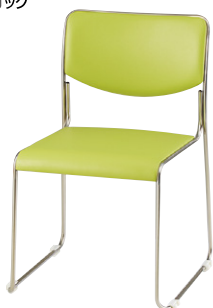
E169-GGR ¥23,300 ◆ 張地：ビニールレザー張り 質量：4.3kg