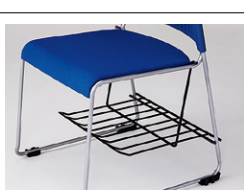
■足元棚 ERK001-BK ¥10,800◎

外寸法/W605×D830×H487 本体：φ25.4スチール丸パイプ粉体塗装仕上 スタック数：最大30脚 寸法：W605×D980×H1790 (30脚積載時) 質量：10.8kg