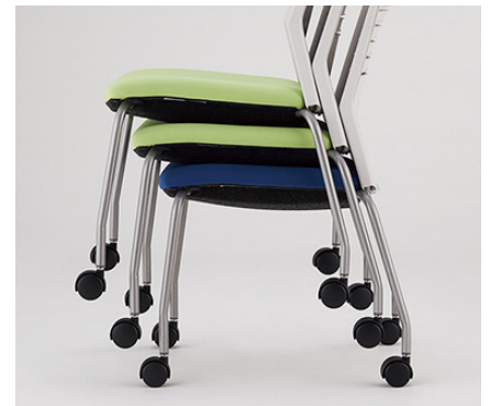
4本脚タイプ・ループ脚タイプはスタッキングが可能。