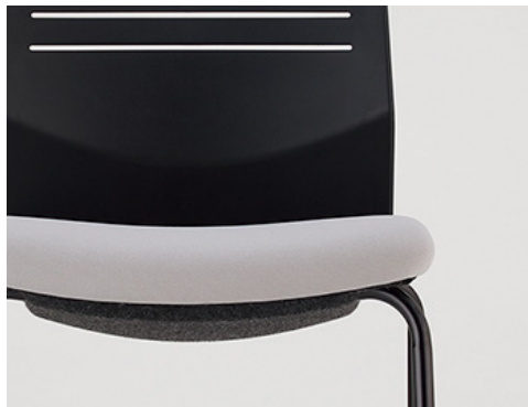
座り心地のよい40mm厚の座クッション。