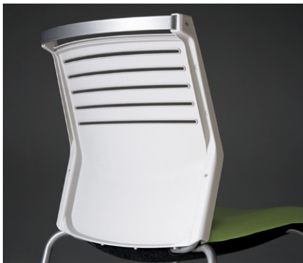
動かしやすく背上部の汚れを防ぐ引手。