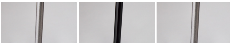
背：ブラック フレーム：シルバー