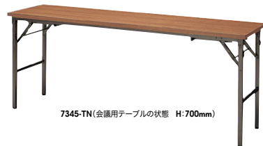
7345-TN(会議用テーブルの状態 H:700mm)