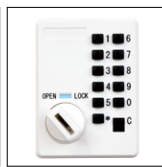
プッシュボタン錠