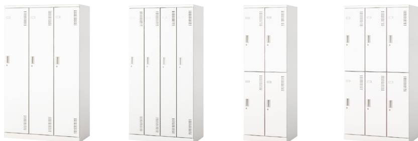
ALN3X-W ALN4S-W ALN4M-W ALN6M-W