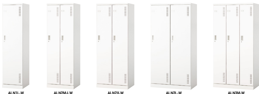
ALN1L-W ALN2M-LW ALN2X-W ALN2L-W ALN3M-W