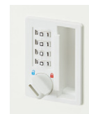
ゼロ復帰ダイヤル錠