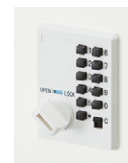
プッシュボタン錠 ※クリアーホワイトのみ