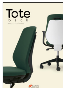
事務用チェア 「トートバック」