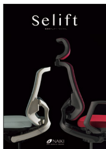
事務用チェア 「セリフト」