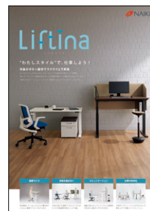
上下昇降テーブル 「リフティーナ」