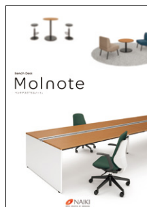
ベンチデスク 「モルノート」