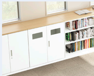
トラッシュボックス

個人やチームの持ち物を収納するためのロッカーです。投入口有タイプは郵便物や配布資料の受け取りにも適しています。