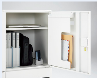
パーソナルロッカー

個人やチームの持ち物を収納するためのロッカーです。投入口有タイプは郵便物や配布資料の受け取りにも適しています。