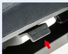
座面奥行き調整機能

体形に合わせて座面の奥行きを調節できます。 ※レバーは着座時、座面左側にあります。