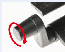
ロッキング強弱調節機能

右側面のレバーを回すことで、体重や好みに合わせて、ロッキングの反発力の調節ができます。