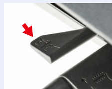
フォワードチルト機能

体形に合わせて座面の奥行きを調節できます。 ※レバーは着座時、座面左側にあります。