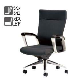
E991F-□ ¥319,100 □ 張地：布張り 質量：28.5kg