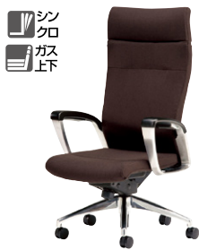
E992F-□ ¥334,800 □ 張地：布張り 質量：31.5kg