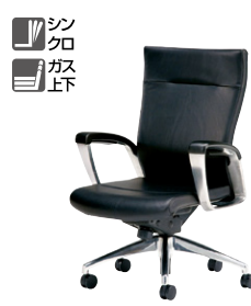
E991L-BK ¥390,500 □ 張地：本革・一部ビニールレザー張り 質量：29kg