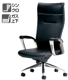
E992L-BK ¥402,800 ◆ 張地：本革・一部ビニールレザー張り 質量：32kg