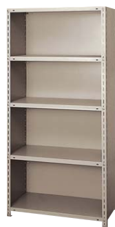
■B型ボックス棚 RLB635-5 ¥53,400 ◆

外寸法/W890×D465×H1800 粉体塗装仕上 A型の背面、側面にスチールパネルを取り付けた物品棚です。