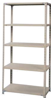
■A型オープン棚 RLA635-5 ¥32,000 ◆

外寸法/W890×D465×H1800 粉体塗装仕上 支柱と棚板で組み立てる最も基本的なアンクル棚です。