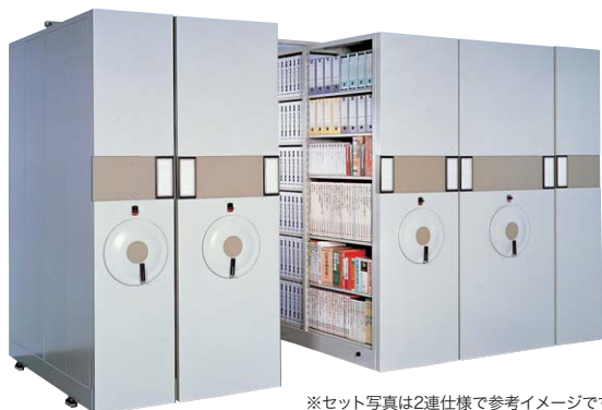
※セット写真は2連仕様で参考イメージです。