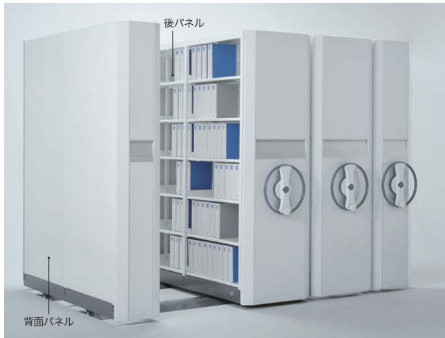
※背面パネルと後パネルはオプションです。