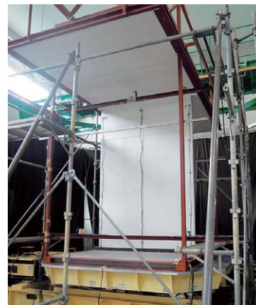
シンクロンは、天井部と床部を専用部品でつなぐ