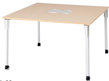
リフトアップキャスター