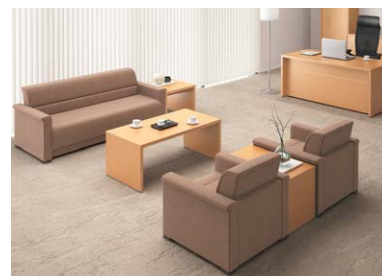
● 応接セットにつきましてはP619をご覧ください。