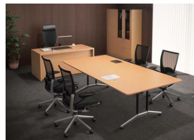
● 会議用テーブルにつきましてはP451をご覧ください。