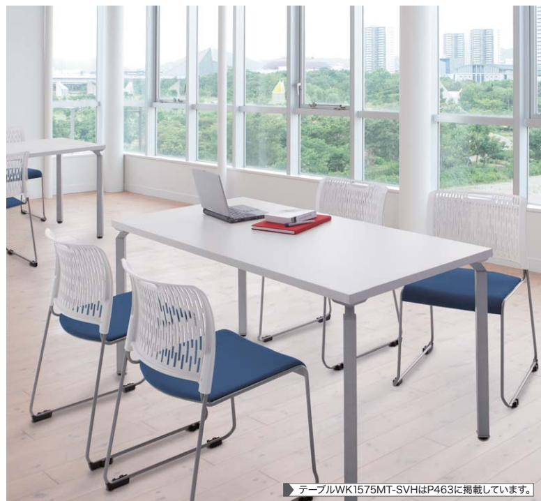
▶ テーブルWK1575MT-SVHはP463に掲載しています。