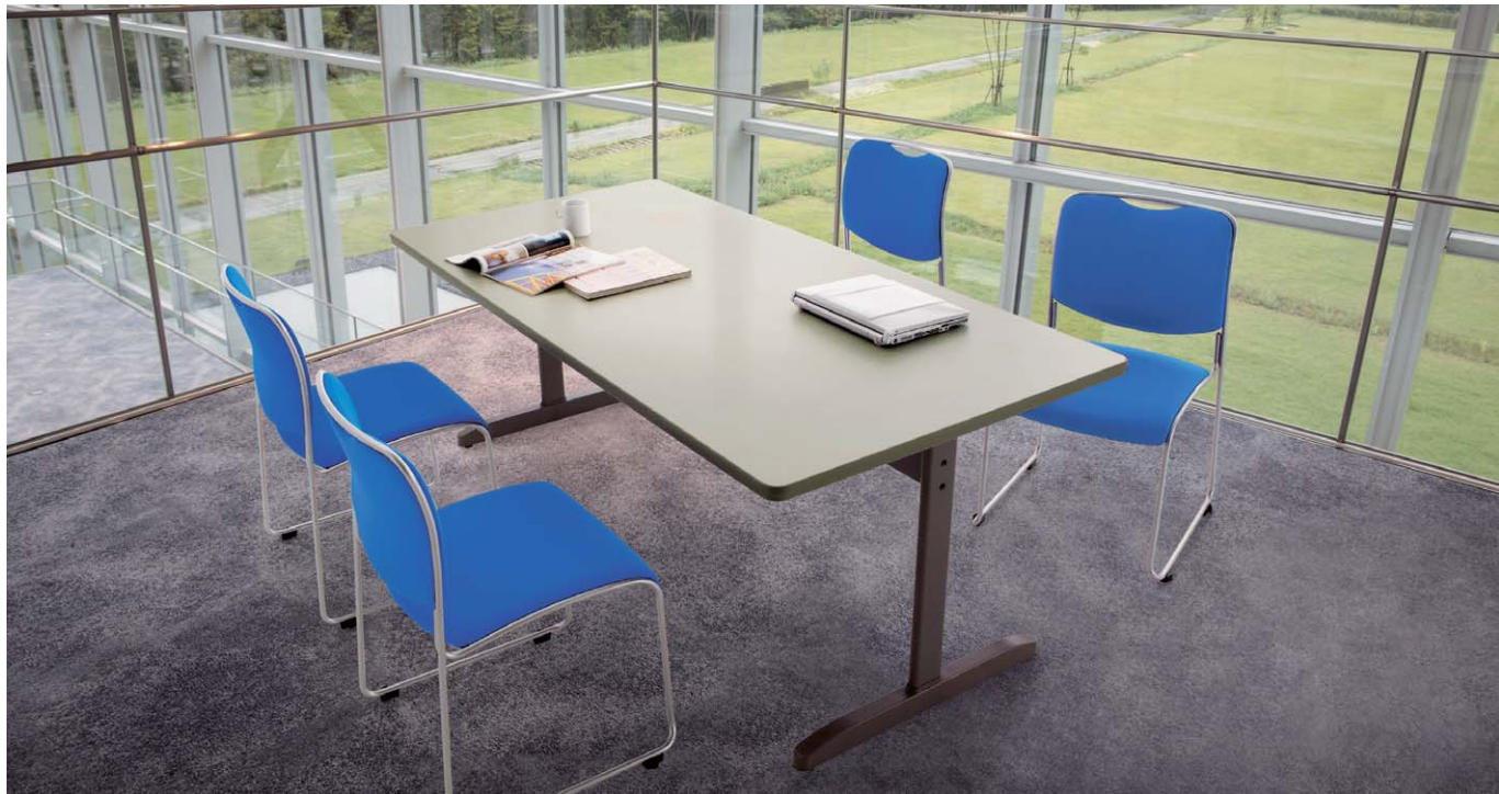
▶ テーブルKHE1890-AWHはP473に掲載しています。