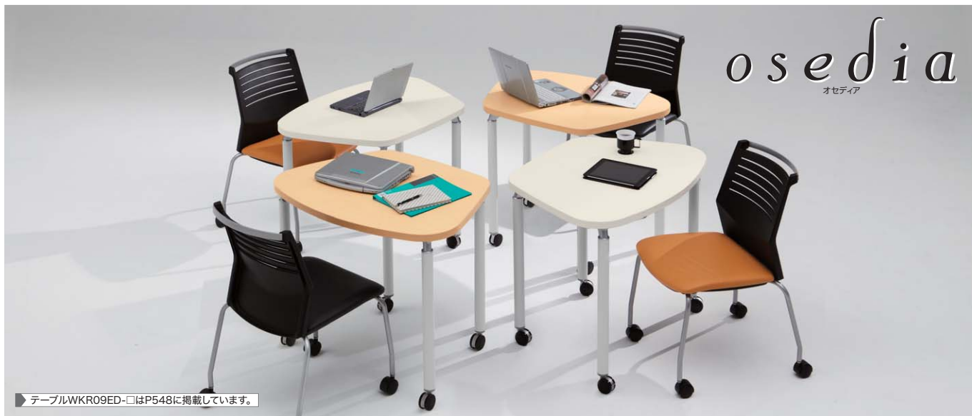
▶ テーブルWKR09ED-□はP548に掲載しています。