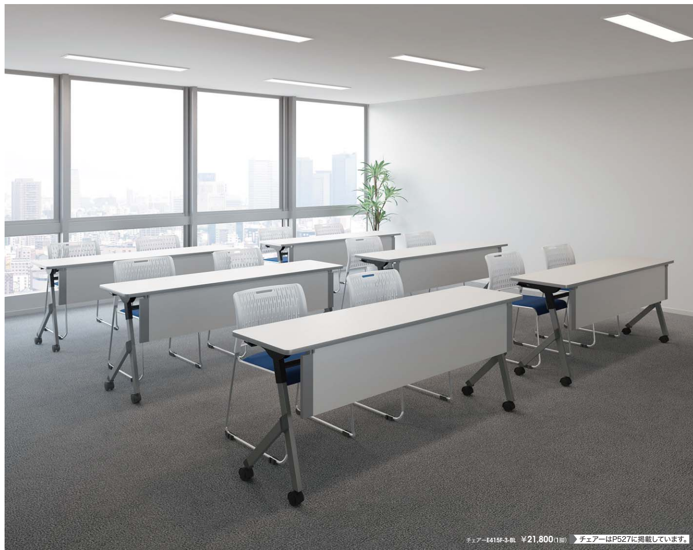
チェア-E415F-3-BL ¥21,800(1脚) ▶チェアはP527に掲載しています。

組立時に高さが選べる平行スタッキングテーブル。高さ700mmと720mmが選択可能です。