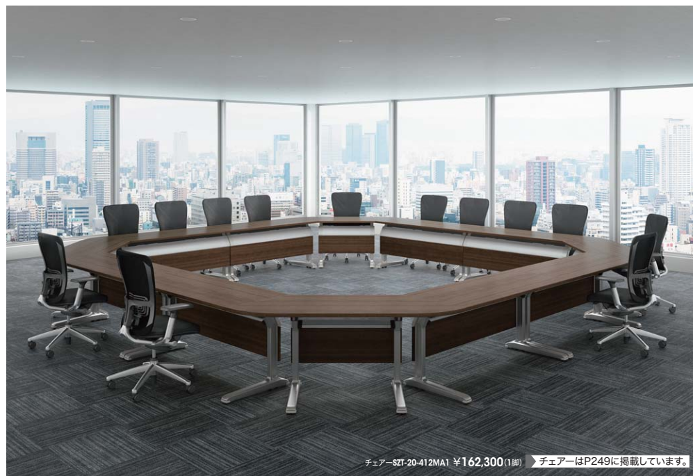
チェア-SZT-20-412MA1 ¥162,300(1脚) ▶チェアはP249に掲載しています。