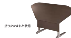
折りたたまれた状態