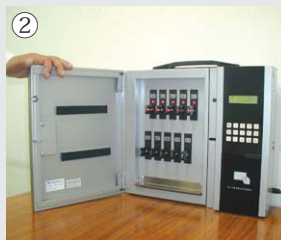
② 登録されていれば前面扉のLEDが点灯し、扉を開けることができます。