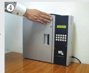
④ ICキーの使用が終わったら、①②と同様の動作を行い、元の場所に戻します。