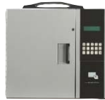
(10キータイプ) SKT-1020 ￥420,000 ※ 外寸法/W375×D120×H330