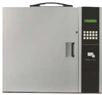
(30キータイプ) SKT-3020 ￥700,000 ※ 外寸法/W515×D120×H438