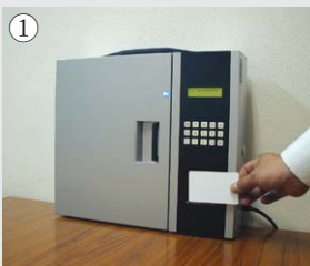
① ICカードをかざします。