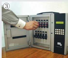
③ LEDが点灯しているデジタル@ICキーのみ、取り出すことができます。