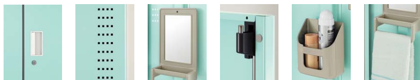
●ラッチ付引手 ●通気孔 ●鏡 ●3点ロック機構 (扉上下・錠前部) ●小物入れ ●タオル掛け