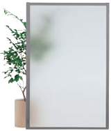
WP70-0914G ¥70,100 外寸法/W900xD24.5xH1372