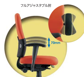
フレキシブル構造

上下スライドと首振り機能により、コンピューターワークで生じる上腕・手首などの疲労を大幅にやわらげます。