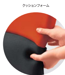
クッションフォーム

座った際に足の裏全体を床に付け、膝が90度になるよう座面の高さを調整することで正しい姿勢が維持できます。